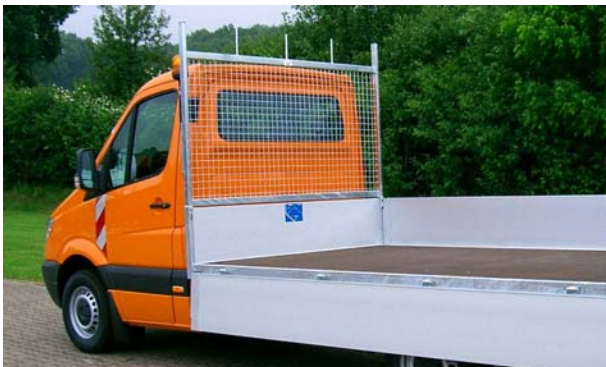
Abb. Stirnwandschutzgitter mit integriertem Leiteraufsatz.