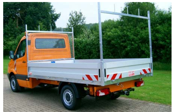
Abb. Stirnwandschutzgitter mit integriertem Leiteraufsatz sowie Leiteraufsatz hinten.